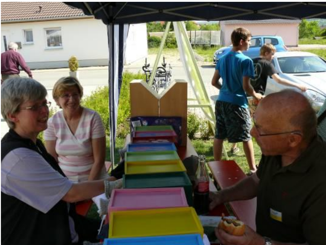
Fühlkästen (Gegenstände im Inneren ertasten – ganz schön knifflig)