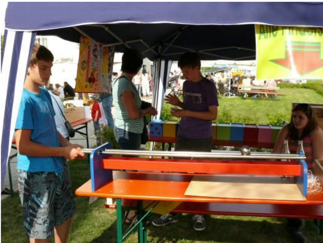
Stahlkugelbahn – gar nicht so leicht, die Kugel bis ins letzte Loch rollen zu lassen.