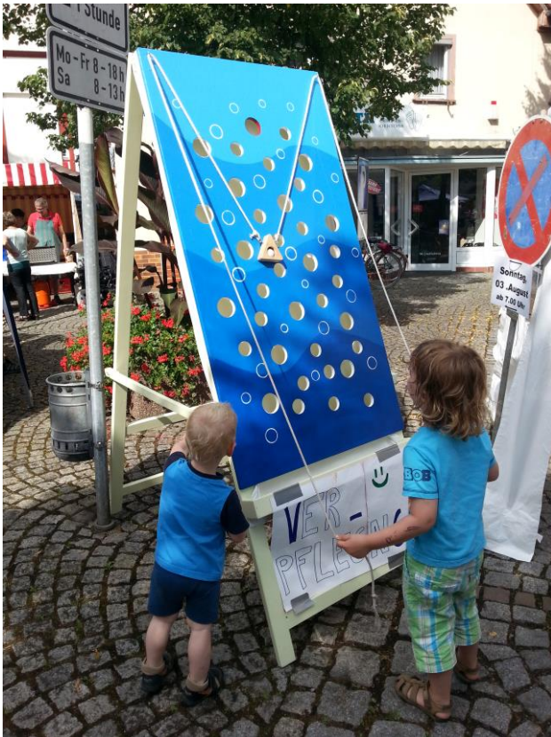
Schräge Lochwand – Großgerät, 2m hoch! Ach als kleines Spiel verfügbar.

Übersicht über die Holzspielgeräte, die ausgeliehen werden können. Kontakt: BürgerNetzWerk Igersheim im Rathaus, Möhlerplatz 9, 97999 Igersheim, Tel. 07931/497-22 E-Mail: buergernetzwerk@igersheim.de