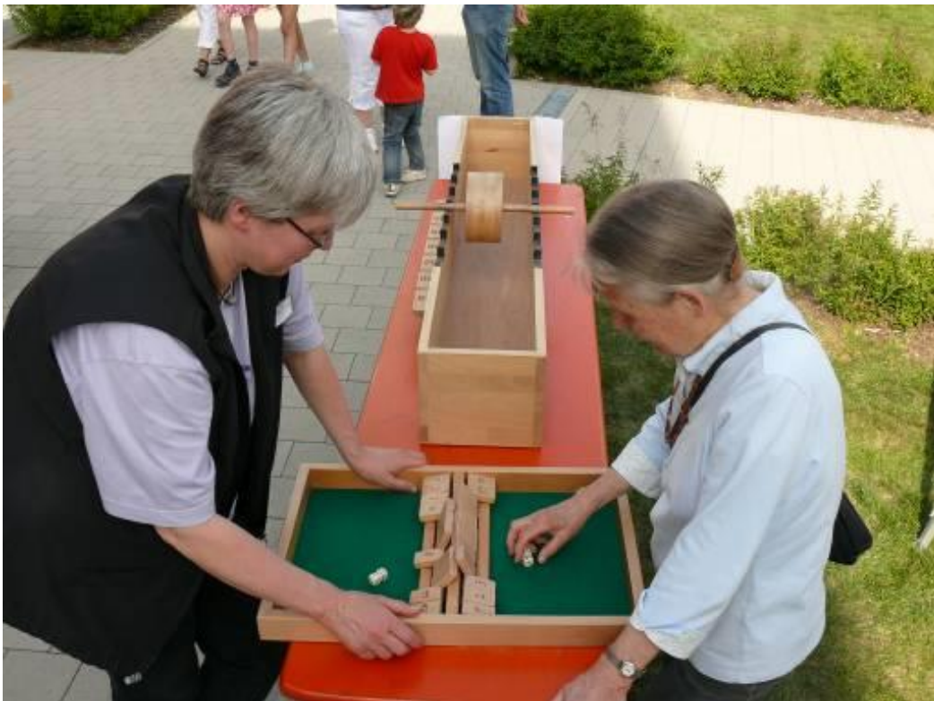
Im Vordergrund: Würfelspiel - wer hat zuerst alle 12 möglichen Zahlen erwürfelt? Im Hintergrund: Holzrad: nur der richtige Schwung bringt volle Punktzahl!