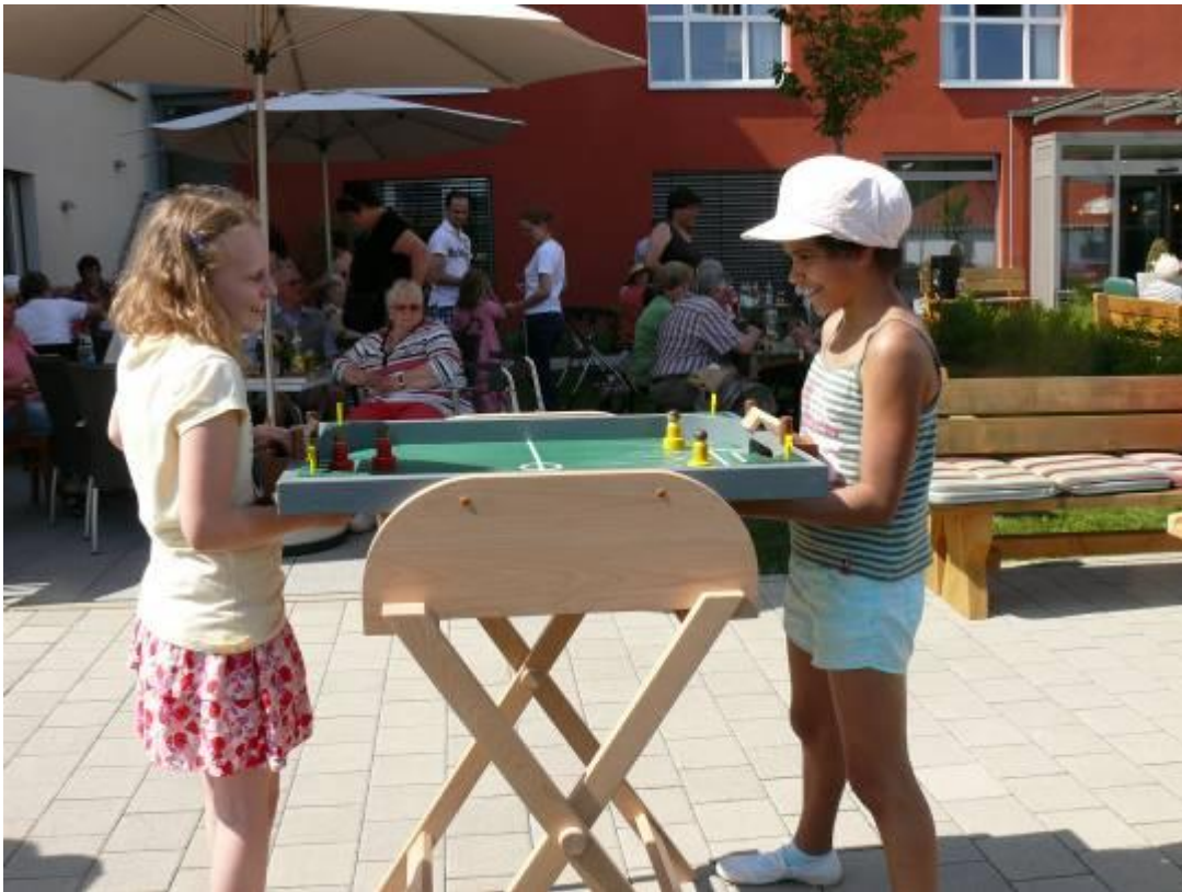
Tischfußball ( 2 verschiedene Versionen vorhanden)

Übersicht über die Holzspielgeräte, die ausgeliehen werden können. Kontakt: BürgerNetzWerk Igersheim im Rathaus, Möhlerplatz 9, 97999 Igersheim, Tel. 07931/497-22 E-Mail: buergernetzwerk@igersheim.de