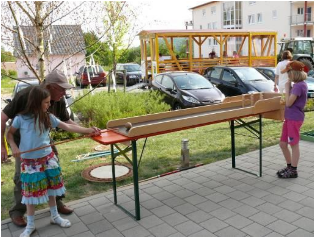
Tischkegelbahn – auf alle Neune! (Großgerät – ca. 2,40m lang!)

Übersicht über die Holzspielgeräte, die ausgeliehen werden können. Kontakt: BürgerNetzWerk Igersheim im Rathaus, Möhlerplatz 9, 97999 Igersheim, Tel. 07931/497-22 E-Mail: buergernetzwerk@igersheim.de