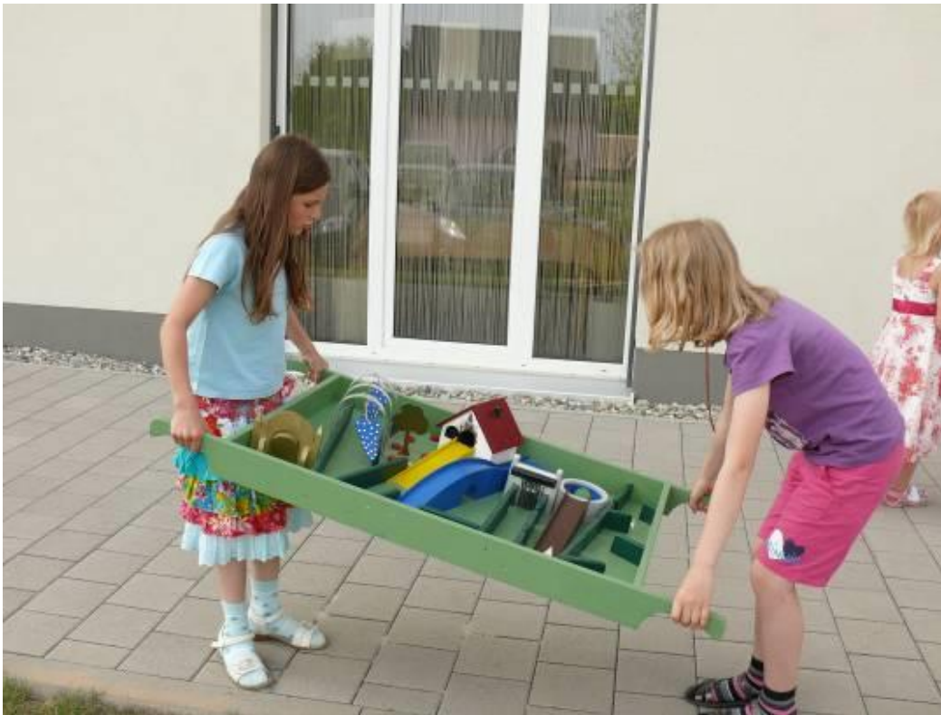
Frau Holle (Partnerspiel, bei dem eine Kugel über einen Parcours ins Ziel bewegt wird)

Übersicht über die Holzspielgeräte, die ausgeliehen werden können. Kontakt: BürgerNetzWerk Igersheim im Rathaus, Möhlerplatz 9, 97999 Igersheim, Tel. 07931/497-22 E-Mail: buergernetzwerk@igersheim.de