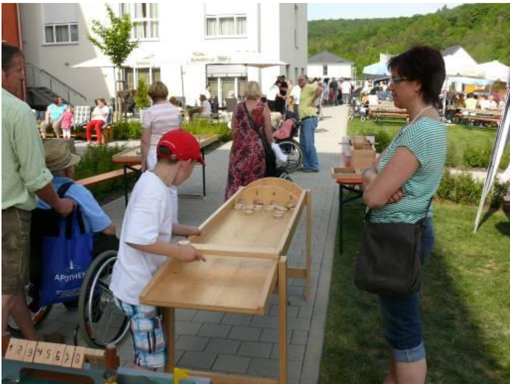
Jakkolo – nur die Puks, die durch die Tore rutschen, werden gewertet! (Großgerät, 2,10m lang)