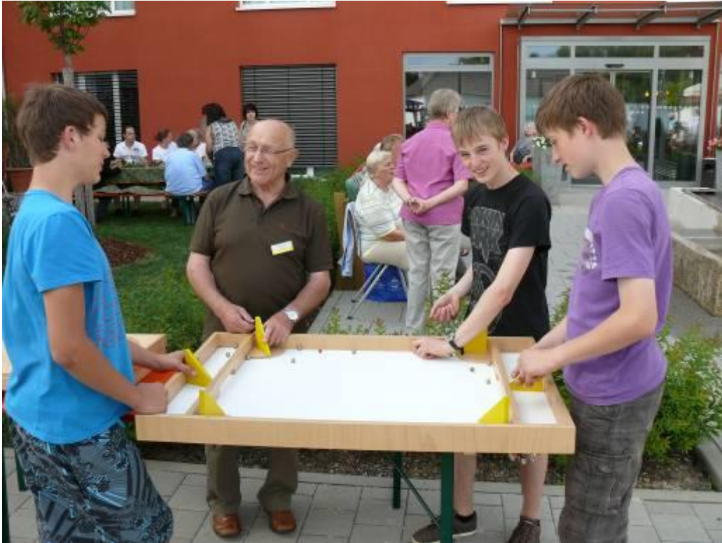
Eishockey (bis zu 6 Spieler versuchen mit ihrer Kugel-Munition die rote Kugel ins gegnerische Tor zu stoßen. Suchtgefahr!!!)

Übersicht über die Holzspielgeräte, die ausgeliehen werden können. Kontakt: BürgerNetzWerk Igersheim im Rathaus, Möhlerplatz 9, 97999 Igersheim, Tel. 07931/497-22 E-Mail: buergernetzwerk@igersheim.de