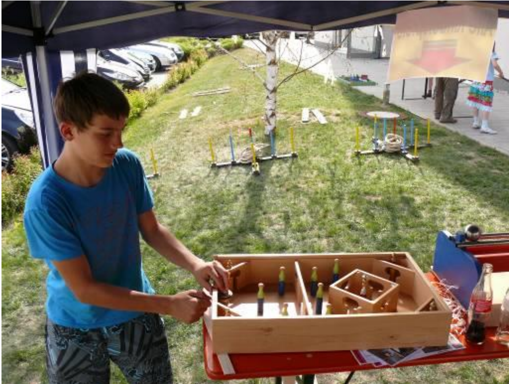
Kreisel-Labyrinth – es geht wirklich: mit der Schnur wird ein Kreisel ins Labyrinth geschickt. Schafft er's, die Ritter und Prinzessinnen auf dem Weg zum König umzukegeln?

Übersicht über die Holzspielgeräte, die ausgeliehen werden können. Kontakt: BürgerNetzWerk Igersheim im Rathaus, Möhlerplatz 9, 97999 Igersheim, Tel. 07931/497-22 E-Mail: buergernetzwerk@igersheim.de