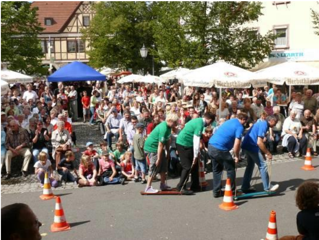
Rasenski für 3 Teams

Übersicht über die Holzspielgeräte, die ausgeliehen werden können. Kontakt: BürgerNetzWerk Igersheim im Rathaus, Möhlerplatz 9, 97999 Igersheim, Tel. 07931/497-22 E-Mail: buergernetzwerk@igersheim.de