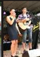
LaRu(h) and friends